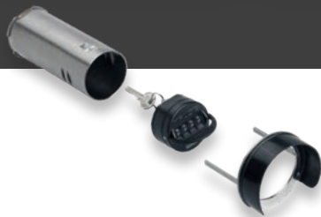
CODE SleutelSafe 70-SKG**