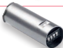
CODE SleutelSafe basic