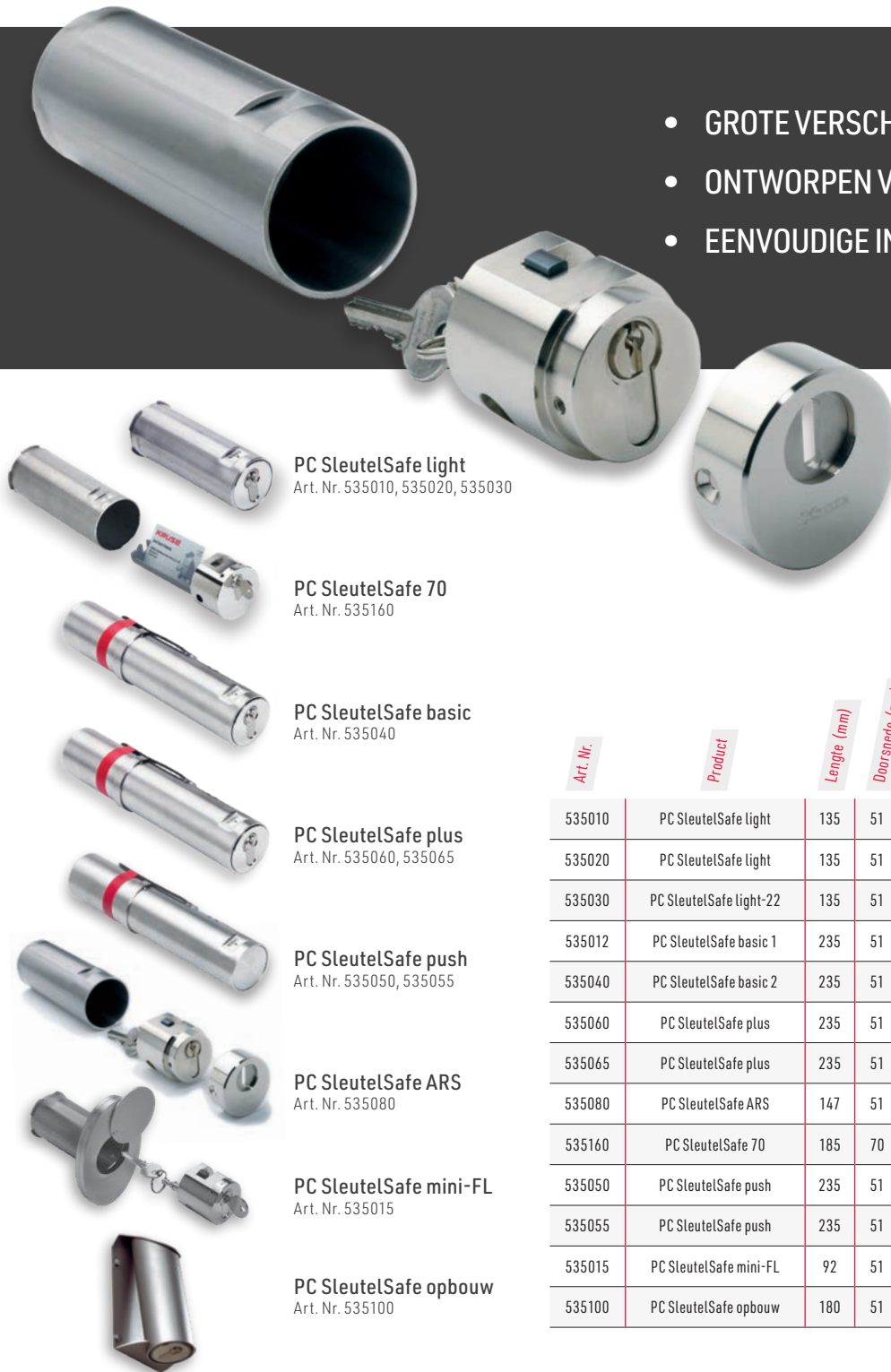
PC SleutelSafe light Art. Nr. 535010, 535020, 535030